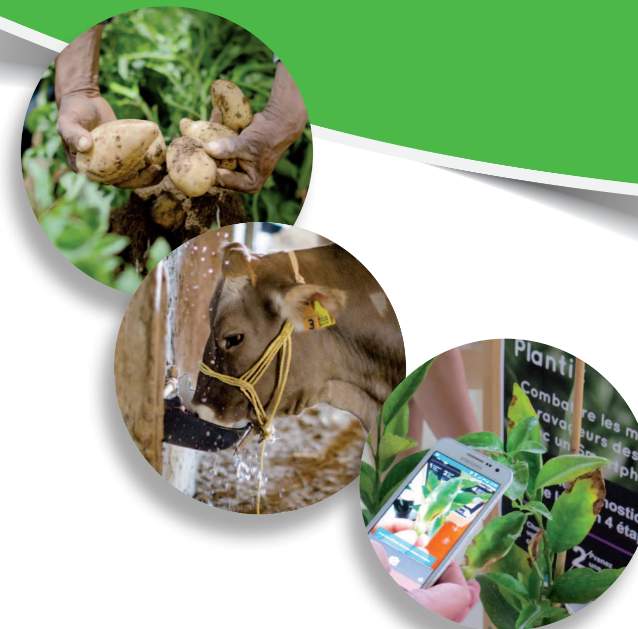
Version : 10/2017 - 26 417 818